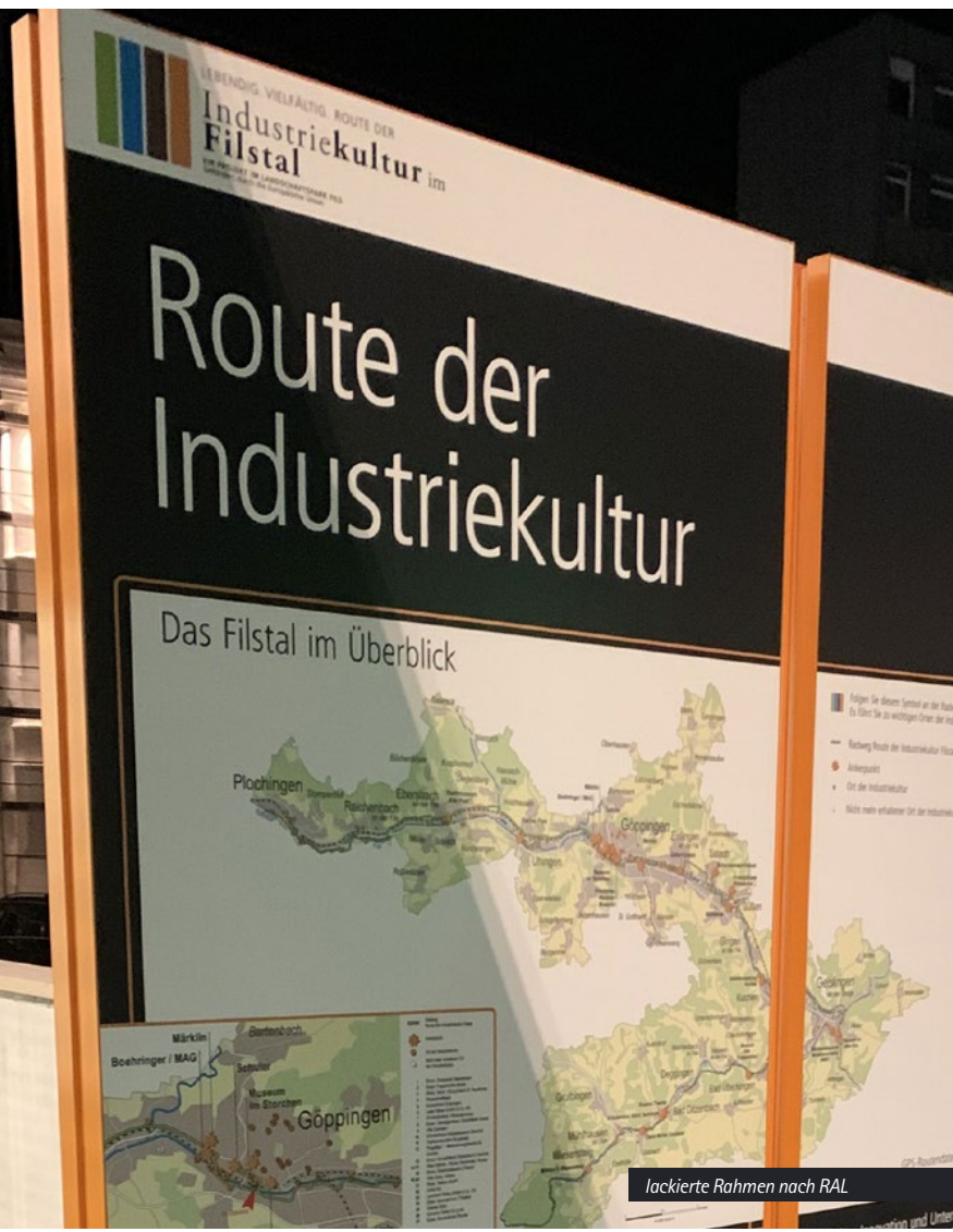
lackierte Rahmen nach RAL