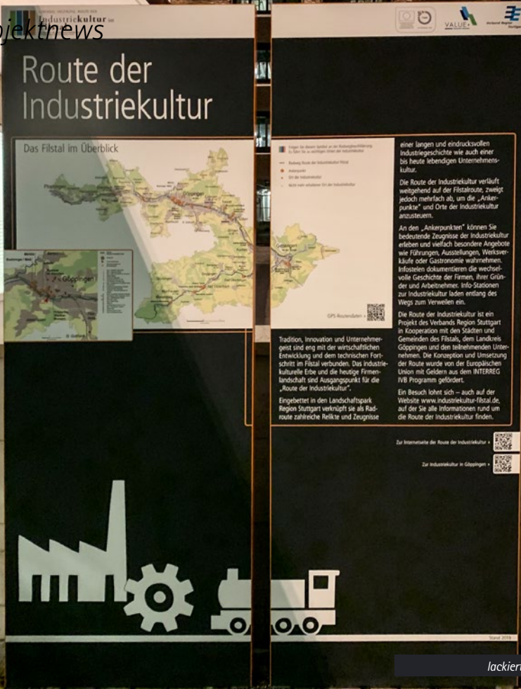
lackiert nach RAL